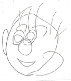
「おまつり わっしょい」

「あんJOY楽しかった？」と聞くと、「あんちゃんいた。」と真っ先に大好きなあんちゃんの名前が出てきました。友達と一緒にロケットに入り、窓から顔を出して宇宙空間を楽しめたね。