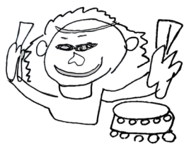
「たいこをやったよ」

三年生は、「四季の歌」を発表しました。僕は、冬組でした。帽子の踊りをやりました。帽子をかぶるのが、上手にできました。ナレーターのを覚えて言えました。楽しかったです。