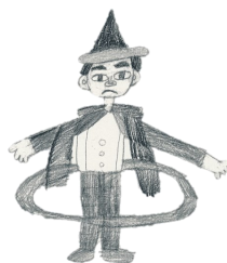
「フラフープ大成功」

舞台発表をしました。「自分への手紙」は部活動をテーマにして、みんなでダンスを発表しました。「家族への手紙」は一人で読みました。本番が近づくと緊張しましたが、最後まで頑張れました。