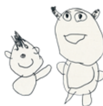
「わくわくうちゅうたんけんたい」

オープニングにて…かきつばたあんちゃん、いるかな。かわいね。学年発表にて…さたんいるね。ピンち！あんとかせんたい4ねんじやー！あか、あお、みどり、だんけつ。やっつけた！