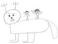
「宮島の鹿」 高松 悟司